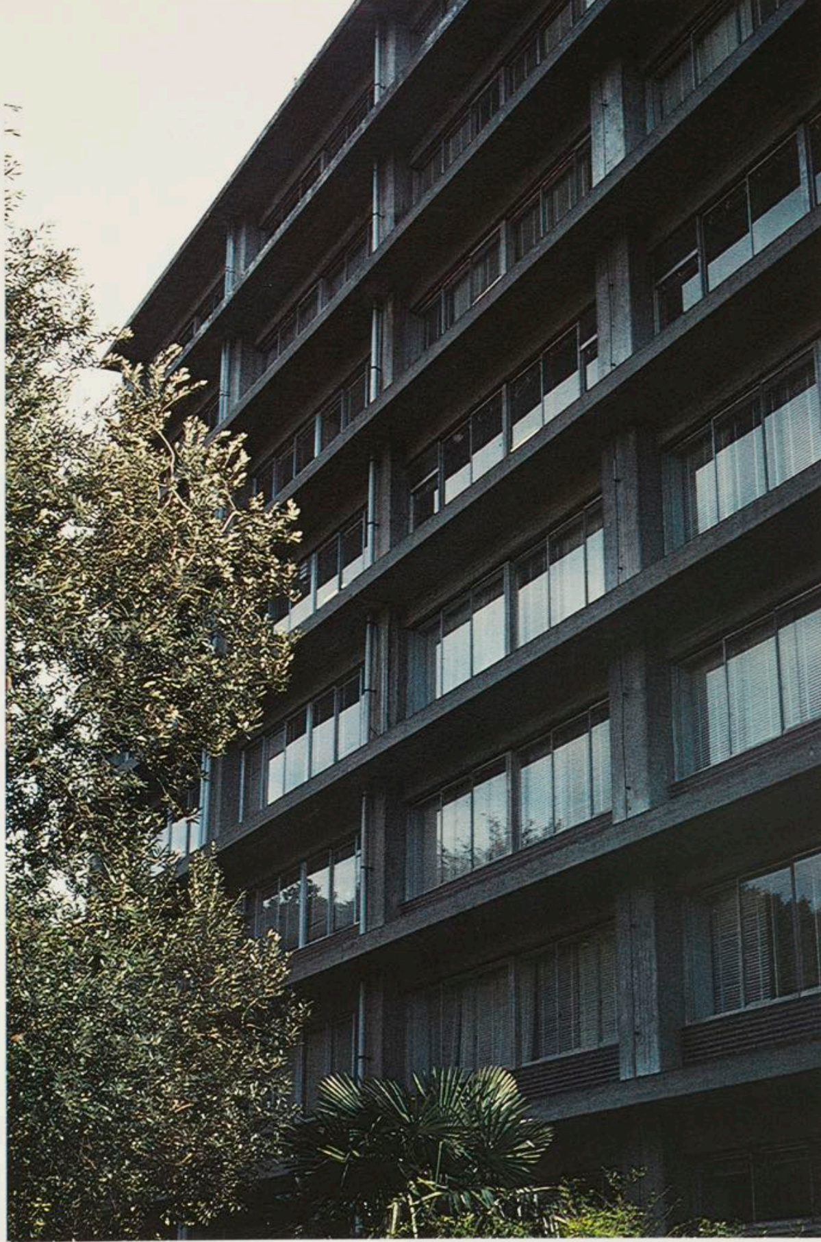
東京大学東洋文化研究所