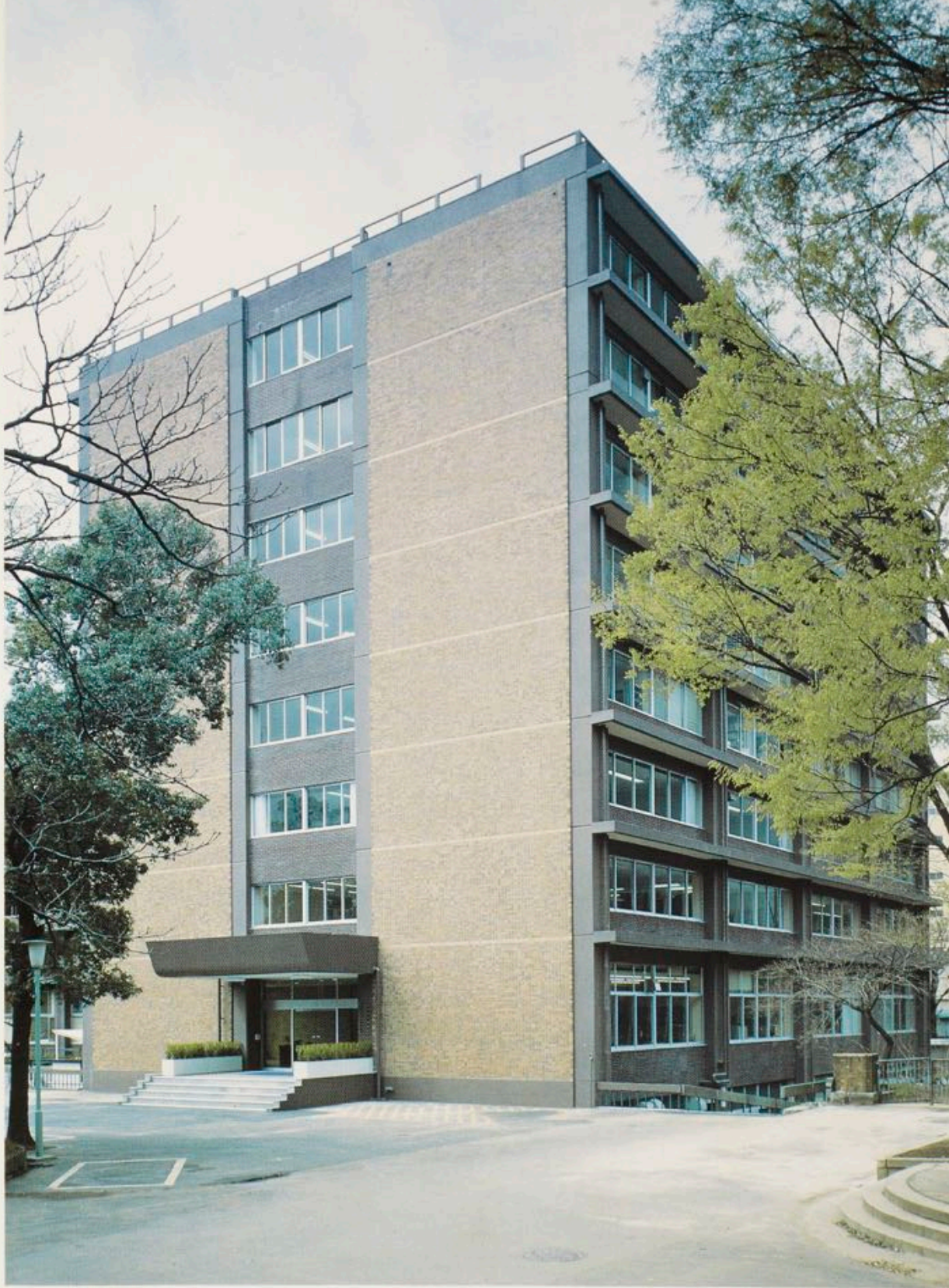
東京大学東洋文化研究所